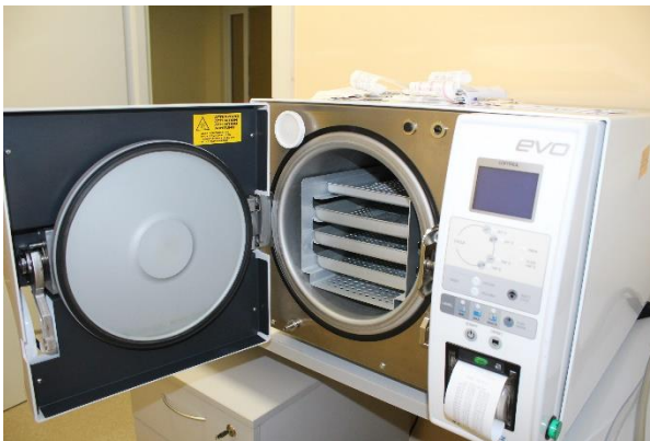
Paveikslas Nr. 4

Projekto „Pirminės asmens sveikatos priežiūros paslaugų kokybės ir prieinamumo gerinimas tikslinėms grupėm“ metu įsigytas naujas autoklavas